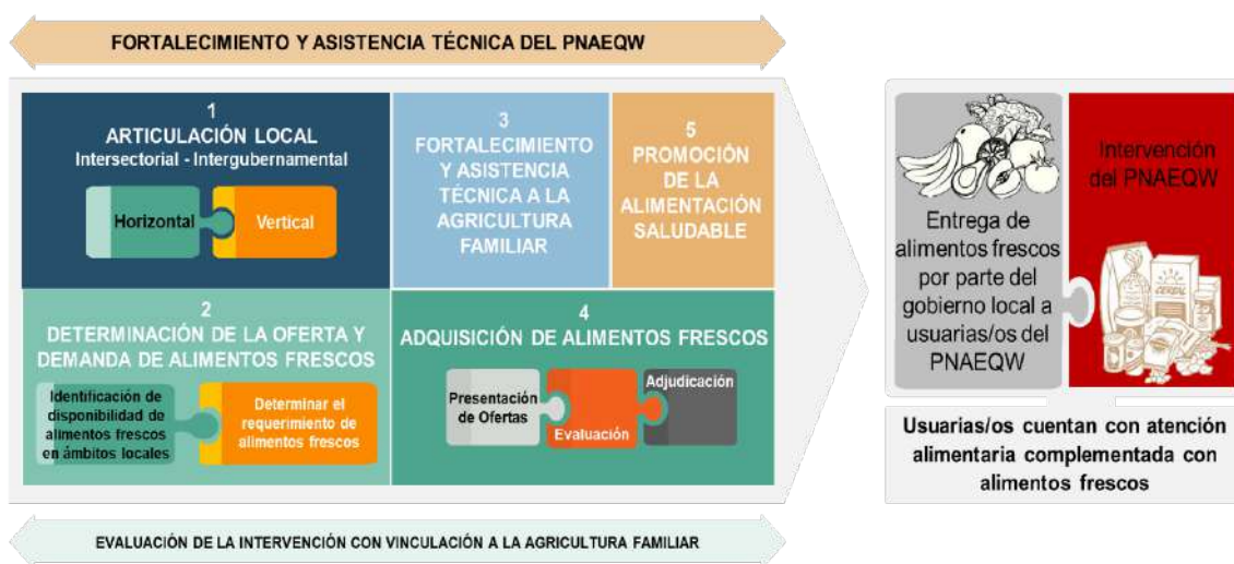
GRÁFICO N° 1: MODELO OPERACIONAL

A continuación, en el Grafico N° 01 se visualiza el Modelo Operacional, incluida sus cinco fases que se detallan en el numeral 8.2 del presente documento.